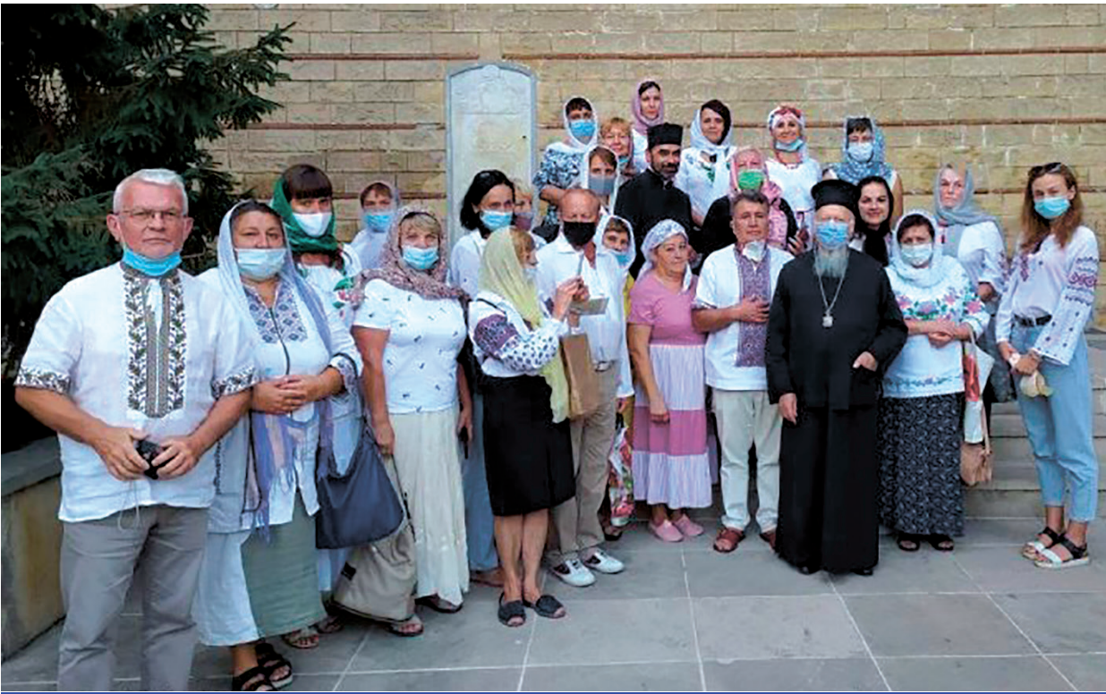
Вселенський Патріарх Варфоломій із волинськими прочанами